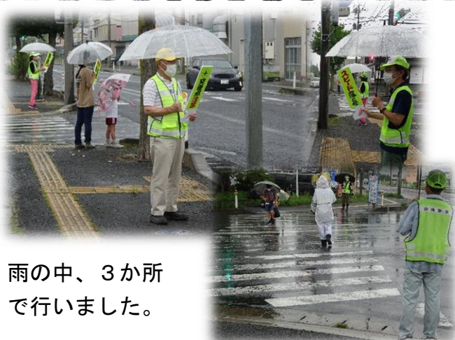
雨の中、3か所で行いました。