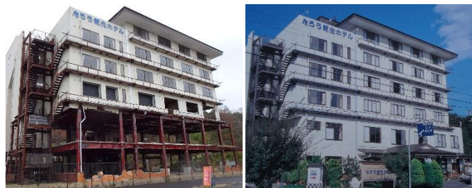
震災後(左)と震災前(右)の『たろう観光ホテル』